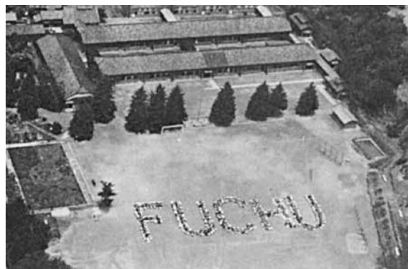
昭和31年5月 明大寺校舎