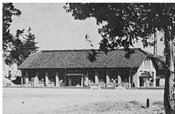
六供のころ 昭和22年度～昭和26年度