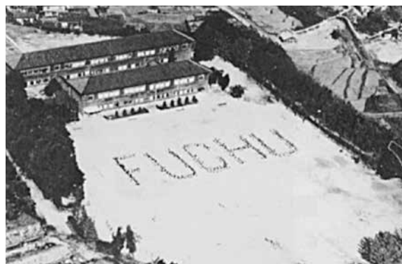
昭和26年11月 愛宕校舎